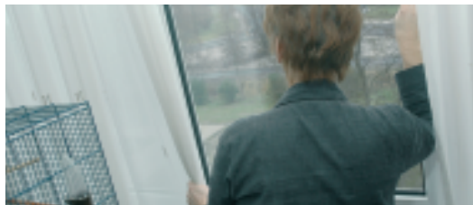
Kom ermee naar buiten!