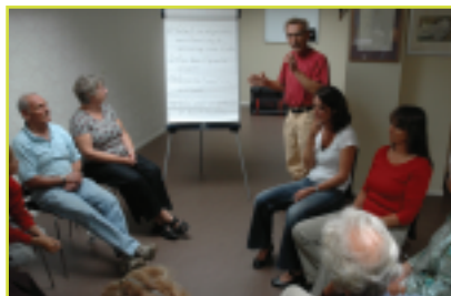
Samen naar een oplossing