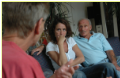
Er komt een Eigen Kracht-coördinator op bezoek