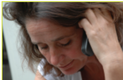
Slachtoffer of dader belt met het Steunpunt

Stap 3 Het plan is klaar. De coördinator komt er weer bij. Eén van de mensen vertelt wat het plan inhoudt. Er wordt met elkaar gekeken of het plan voor iedereen veilig is. Ze spreken ook af wie de groep weer bij elkaar roept als het plan niet volgens afspraak verloopt. Daarna wordt de bijeenkomst afgesloten.